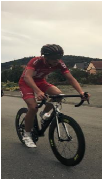
Till beim Radfahren

Die Staffel war eine tolle Erfahrung für uns drei, wobei der Teamgeist sowie der Spaß an einem gemeinsamen Wettkampf oberste Priorität hatte.