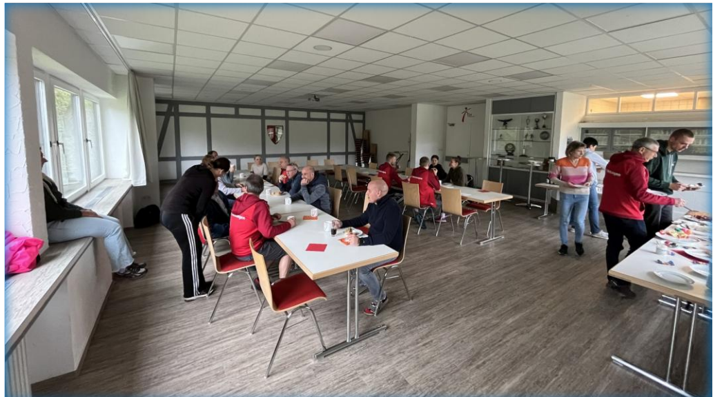
Gemütliches Zusammensein mit Büfett im MT-Vereinsheim.