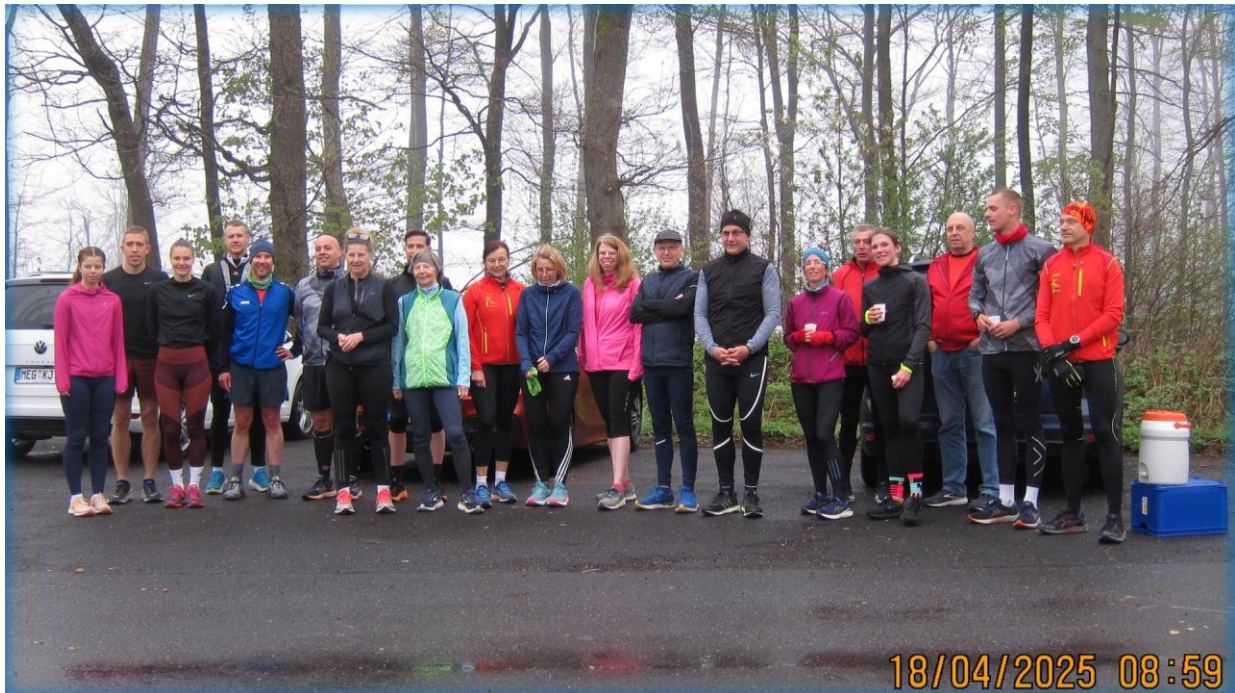
Gruppenfoto am gemeinsamen Startpunkt auf dem Parkplatz am Himmelsberg

Auf dem Parkplatz am Himmelsberg war kurz vor 9:00 Uhr der Treffpunkt mit den per Auto dorthin gefahrenen Teilnehmern für den 16 km langen Lauf zurück zum MT-Vereinshaus.