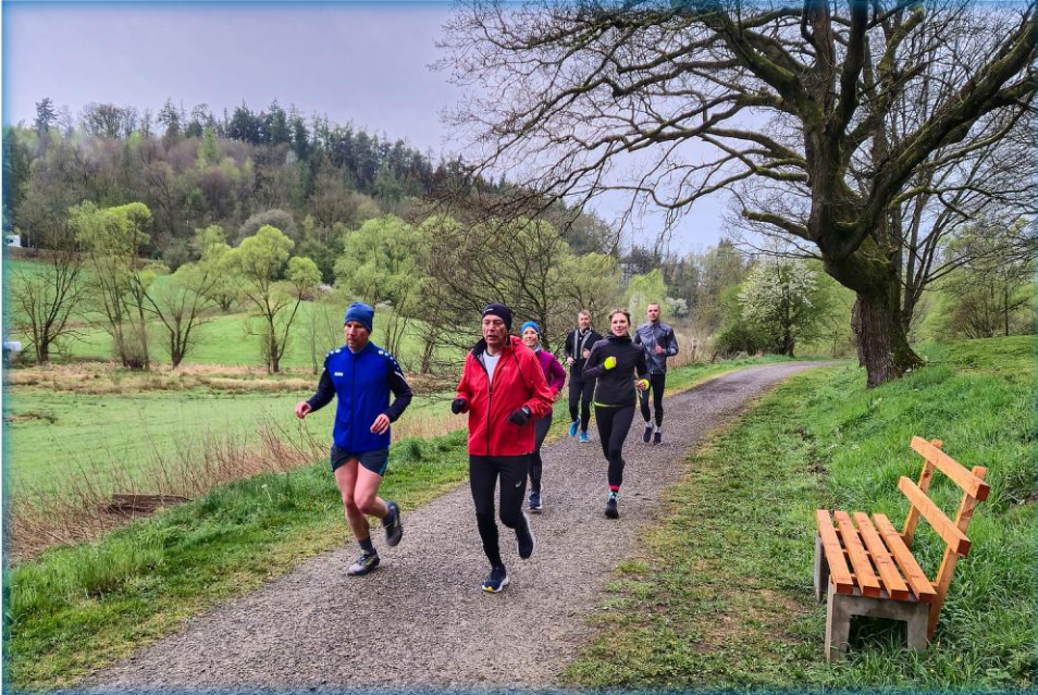
Freitag, 18.4.2025, 7:46 Uhr, auf dem Weg hoch zum Himmelsberg zwischen Melsungen und Kirchhof.

Wie üblich um 7:30 Uhr startete der 14-km-Lauf hoch zum Himmelsberg, diesmal mit 7 Läufer/-innen.