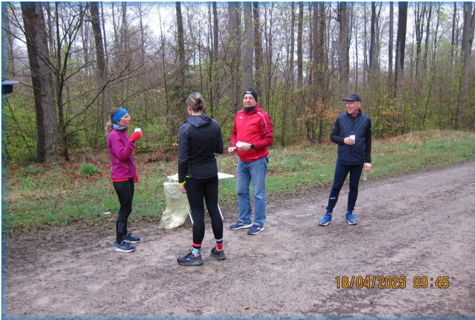
Teestation an der Gehegestraße.

An der Gehegestraße, ca. 8 km nach dem Start vom Parkplatz am Himmelsberg, gab es die von Torsten betreute Teestation.