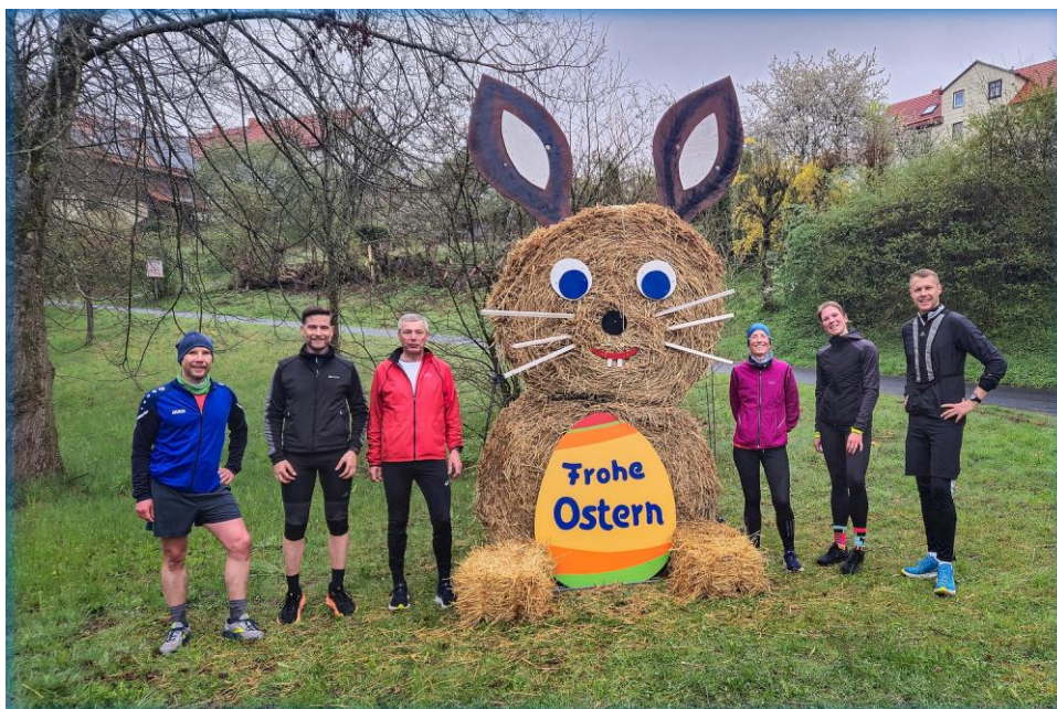
Am Strohoesterhasen in Günsterode.

Am Ortseingang von Günsterode (km 11) stand der traditionelle Strohballen-Osterhase, der natürlich wie üblich als Fotokulisse genutzt wurde.