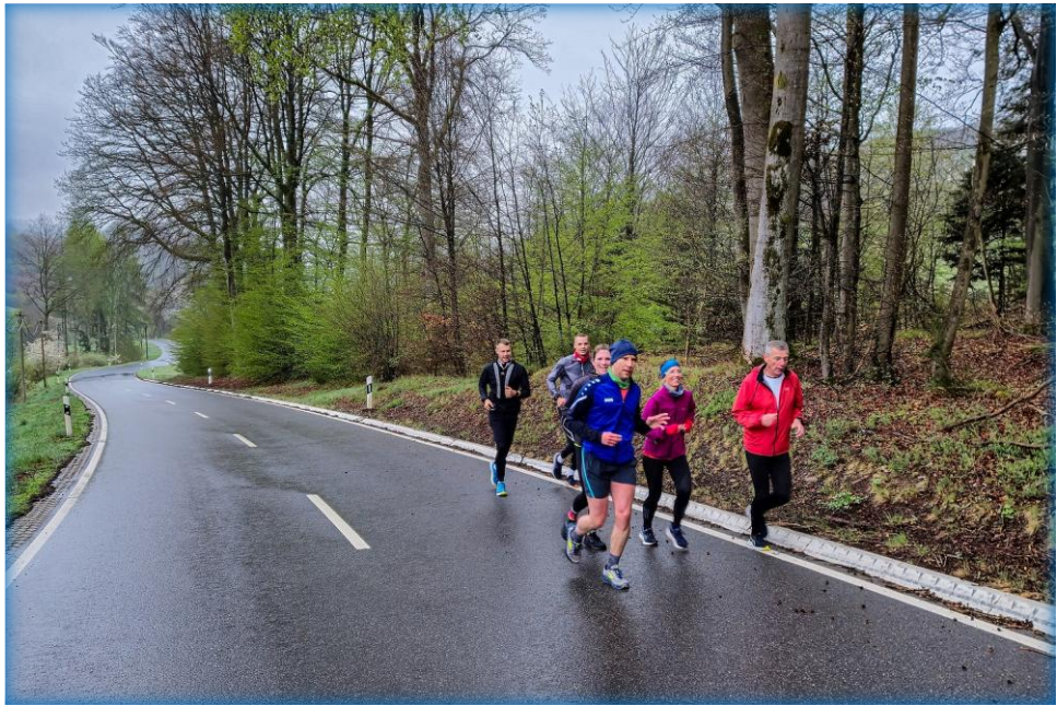
Der letzte und schwerste Anstieg hoch zum Himmelsberg.

Hinter Günsterode musste dann auf dem letzten Kilometer noch der steilste Anstieg der Strecke hoch zum Parkplatz am Himmelsberg geschafft werden.